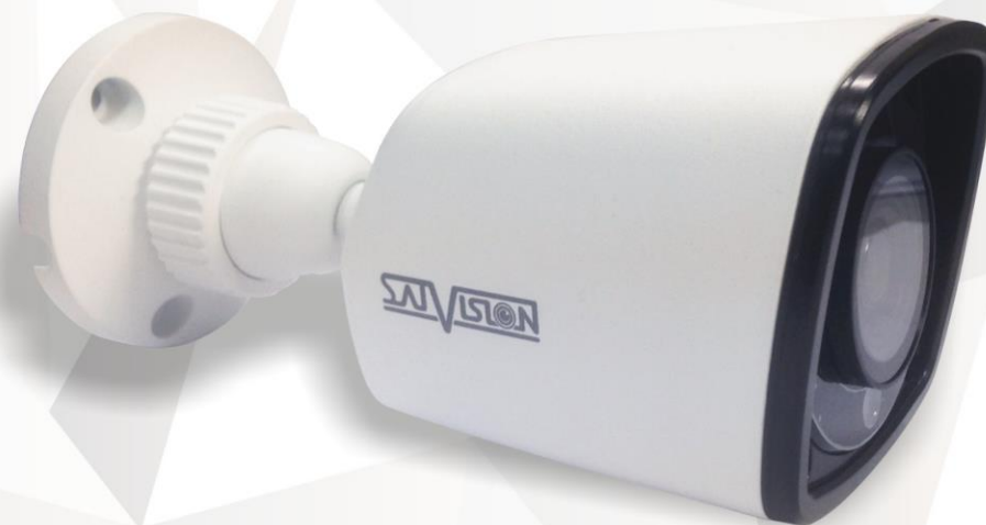
SVI-S122 SL PRO