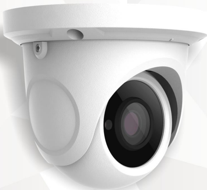
SVI-D222 SL PRO